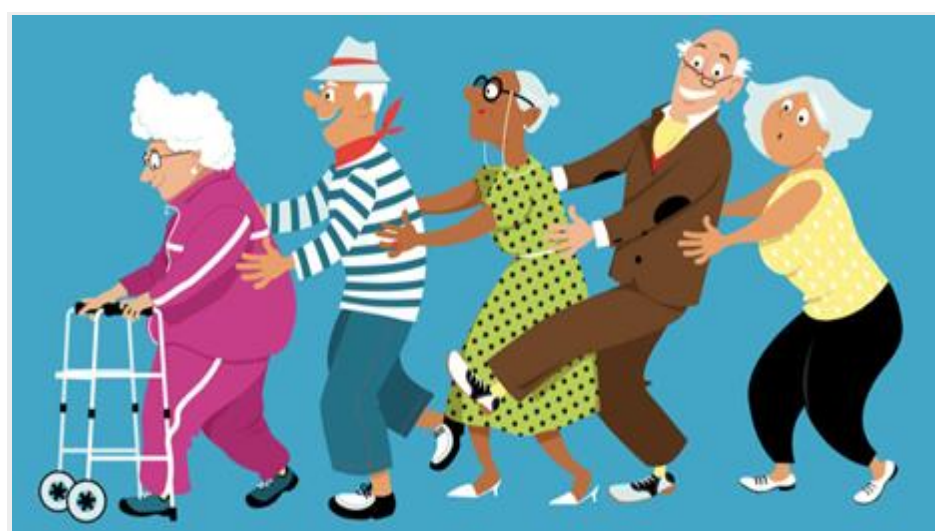
O objetivo da vida é a felicidade, independentemente da idade

Os resultados esperados são que a percepção negativa da velhice pelo idoso interfere na forma como ele vivencia o seu dia a dia e correlaciona-se com sentimentos de solidão, depressão, ansiedade e baixa resiliência. Portanto, a promoção de saúde mental na população idosa apresenta-se como um desafio no âmbito dos cuidados a saúde e de apoio social, sendo importantíssima uma intervenção integrada destes setores de forma a responder às necessidades emergentes deste grupo populacional.