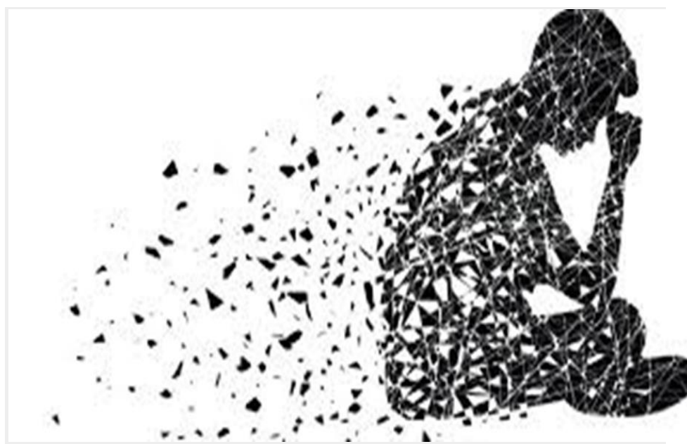
Somos repletos de pedacinhos e história contada ao longo dos anos