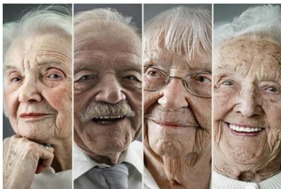
Imagem de idosos

Trata-se de um estudo quantitativo e qualitativo do tipo descritivo e correlacional, realizado no SESC, unidades do Rio Grande do Sul nos grupos de apoio aos idosos. A amostra será constituída de idosos acima de 60 anos, de ambos os sexos, residentes na comunidade, não institucionalizados, lúcidos, capazes de responder ao levantamento dos dados sócio demográficos, as escalas e a entrevista individual. Os instrumentos que serão utilizados são: Questionário sócio demográfico, elaborado pela autora, com perguntas como idade, sexo, escolaridade, atividade profissional, estado civil, com quem reside, entre outros. Além disso, serão aplicadas as seguintes escalas: Escala de Ansiedade Geriátrica; Escala de Auto Estima de Rosenberg; Escala de Estresse Percebido; Escala de Satisfação com a Vida; Escala de Bem Estar Social de Keyes e Questionário Geriátrico de Qualidade de Vida.